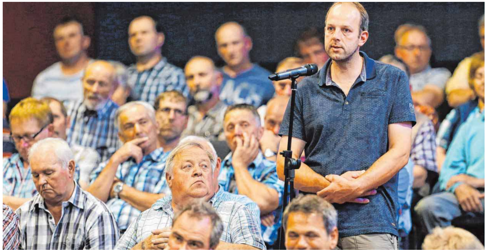
Auch Zuhörer - überwiegend Landwirte - beteiligen sich an der Diskussion in der Festhalle.