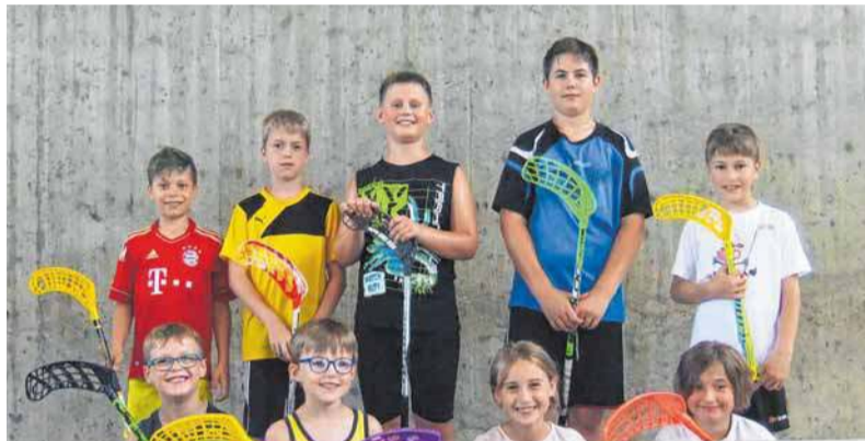
Diese Kinder und Jugendlichen haben erfolgreich am Probetraining in den Ferien teilgenommen.

Alle Interessierten sind eingeladen, nach den Sommerferien an den Floorball-Jugendtrainings in der Herrschaftsbrühlhalle (U9) und ABG-Turnhalle im Schlossbezirk (U11) teilzunehmen. Das Training startet am Samstag, 16. September, jeweils um 16 Uhr.