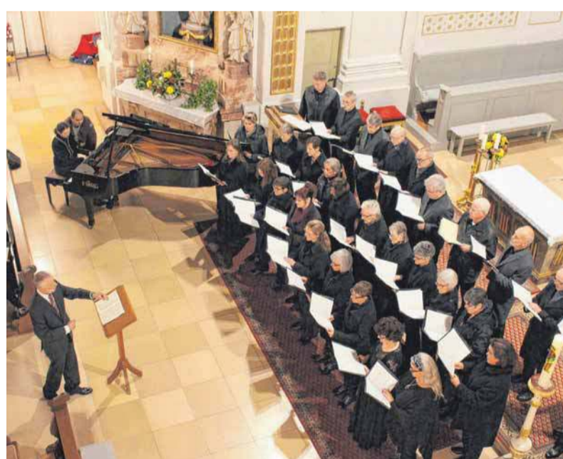
Der Kirchenchor St. Verena, hier in der Stadtpfarrkirche, tritt am Sonntag, 24. Juni, im Barocktreppenhaus des Schlosses auf.